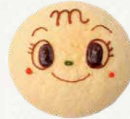
メロンパンちゃん ¥480

とろけたメープルマーガリン Melted maple margarine 枫糖浆人造黄油 메이플 마가린